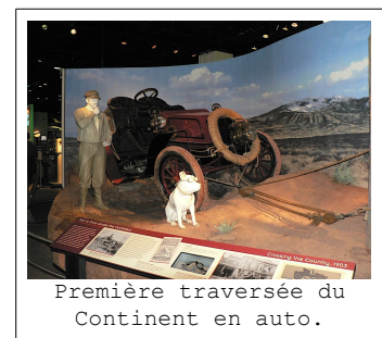
Première traversée du Continent en auto.

Alors oui, c'est sur quatre roues que le tour sera fait. Mais quelle solution choisir ?